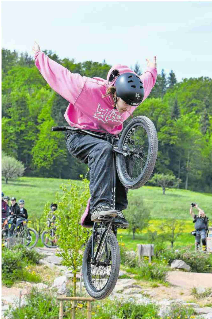
Freihändiger Stunt: Bei der Show wurden spektakuläre Sprünge gezeigt.

Referenz: 91944982 Ausschnitt Seite: 2/4