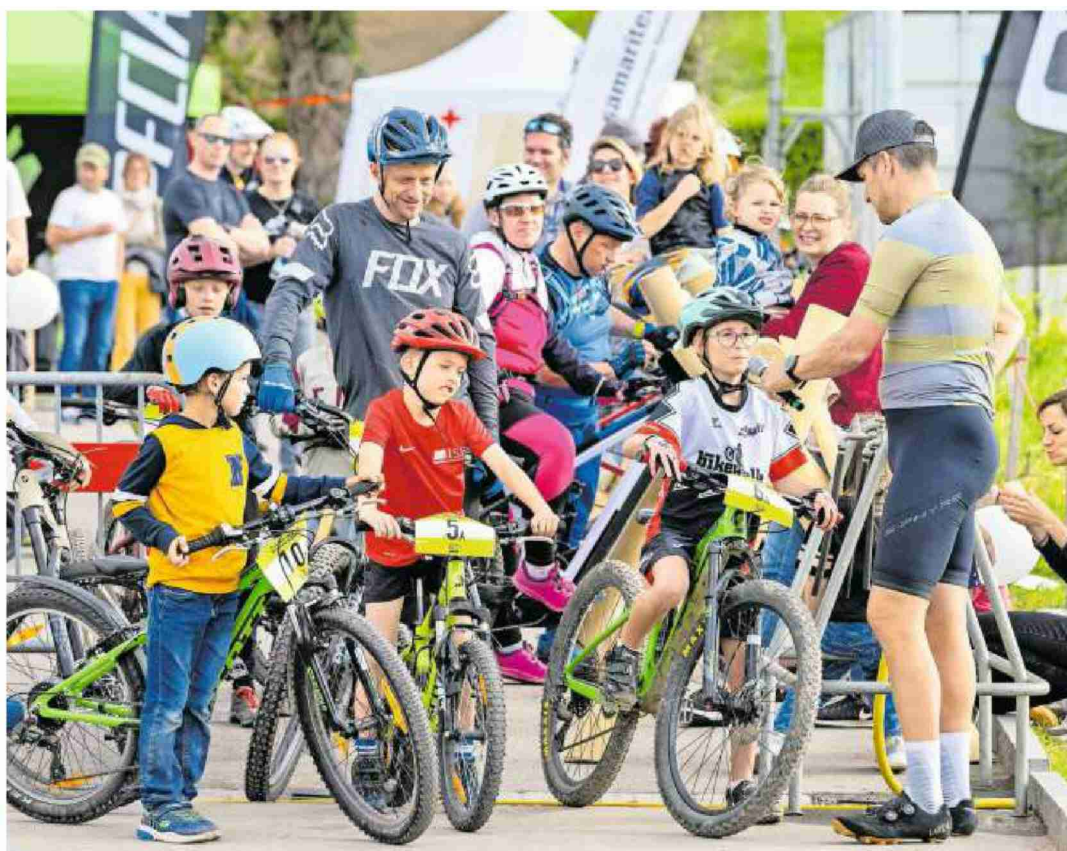
Spass im Fokus: Die Nachtstafette wurde von Olympiasieger Franco Murrelli (r.) moderiert.