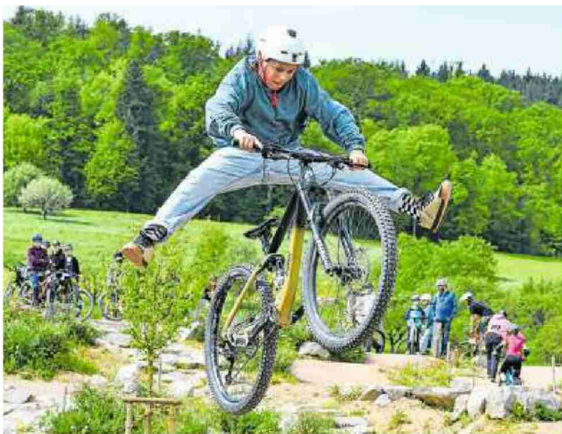
Showeinlagen: Die Sprünge des Nachwuchses faszinierten das Publikum.