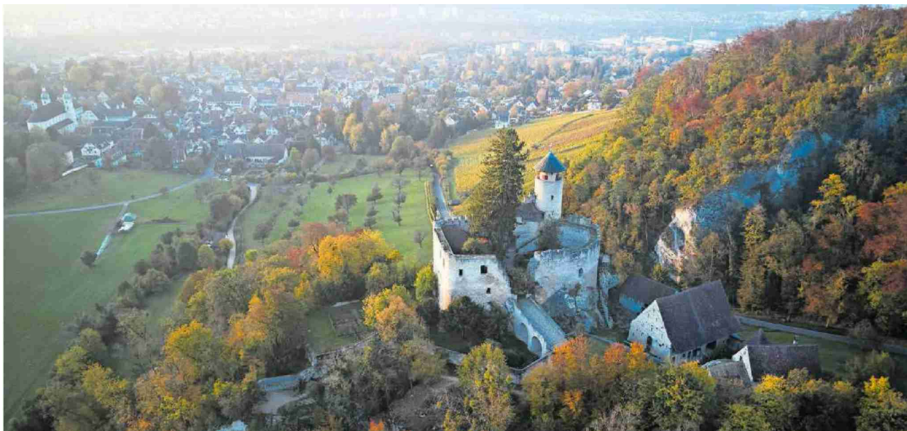
Malerische Landschaften, historische Bauten: Arlesheim hat viel zu bieten.