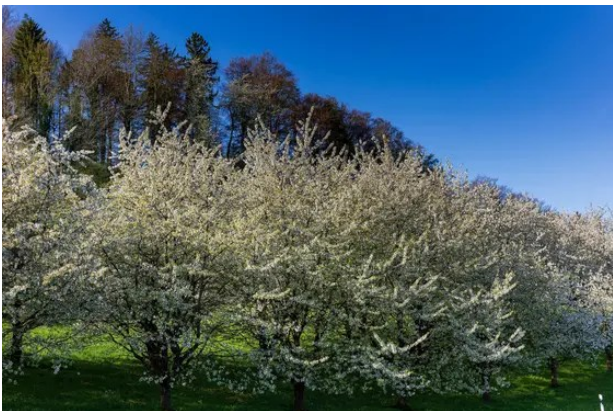
Blueschtfahrt durch den Chirsikanton - drei Expeditionen aufs Land