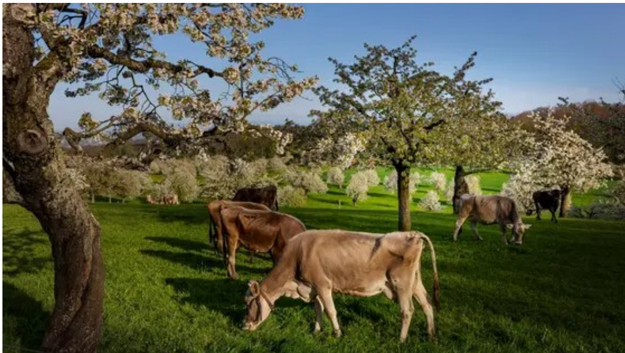
Tiefer Einblick in die Seele des Baselbiets: Weidende Kühe unter den blühenden Bäumen auf der Schönmatte ob Arlesheim.