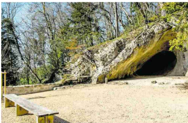
International bekanntes Idyll: Die Ermitage lockt unzählige Besucherinnen und Besucher an.

«In diesem Sommer wird Arlesheim sogar in einem National-Geographic-Reiseführer auf Japanisch vorgestellt», erzählt Quattropiani weiter. Der Fotograf sei vor zwei Monaten aus Japan angereist, um Arlesheim zu fotografieren. Geeignete Motive dürfte dieser zur Genüge finden.