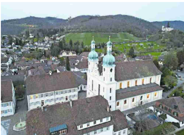
Wahrzeichen der Gemeinde: der imposante Dom von 168