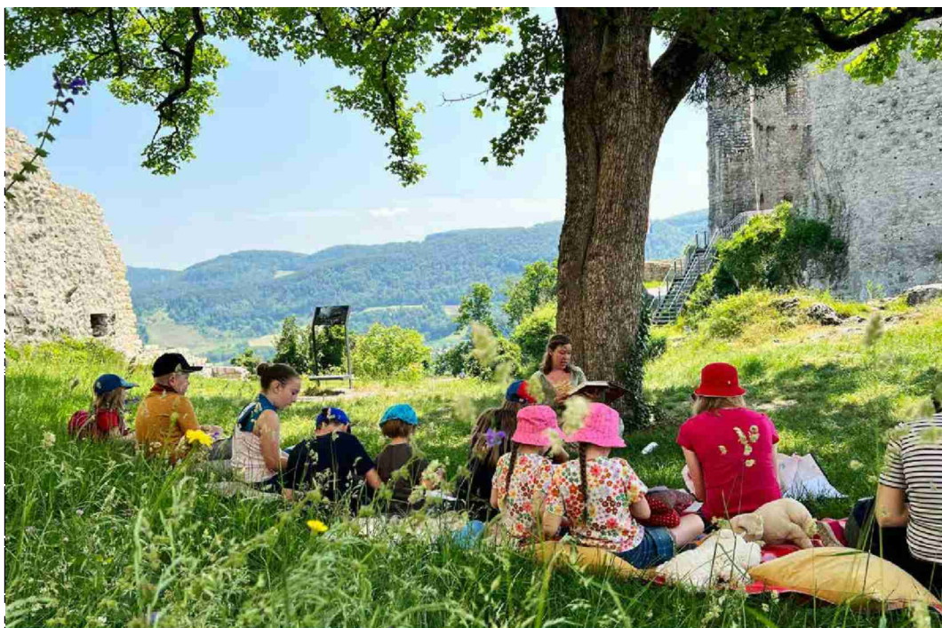
Eindrücke von der Burgenwanderung 2023 auf die Ruine Pfeffingen.