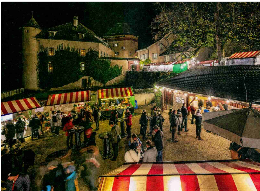
Weihnachtsmarkt Schloss Wildenstein