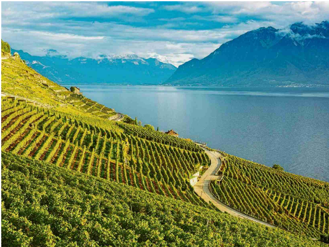
Der Klassiker der Schweizer Rebenwanderungen mit zauberhaftem Blick auf den Genfersee: Die Weinterrassen von Lavaux stehen seit 2007 unter UNESCO-Schutz und gehören somit zum Weltkulturerbe.

Das Wandern ist des Winzers Lust. Man genießt die einzigartige Weinwanderung durch idyllische Rebberge und schmucke Dörfchen – nicht nur in den typischen Weinbaugebieten in der Romandie und im Tessin, sondern auch im Mittelland. Dabei erfährt man Interessantes zum Thema Wein, und lässt sich bei den Winzern mit einer Kostprobe verwöhnen.