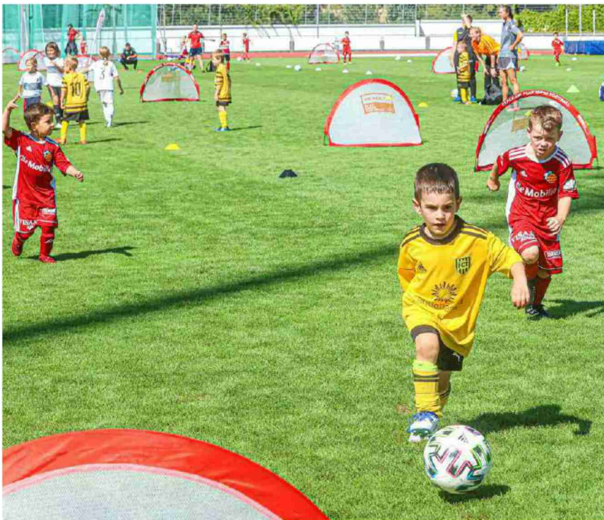
Auch in diesem Jahr profitierten zahlreiche Fussballturniere von Beiträgen aus dem Swisslos-Sportfonds.