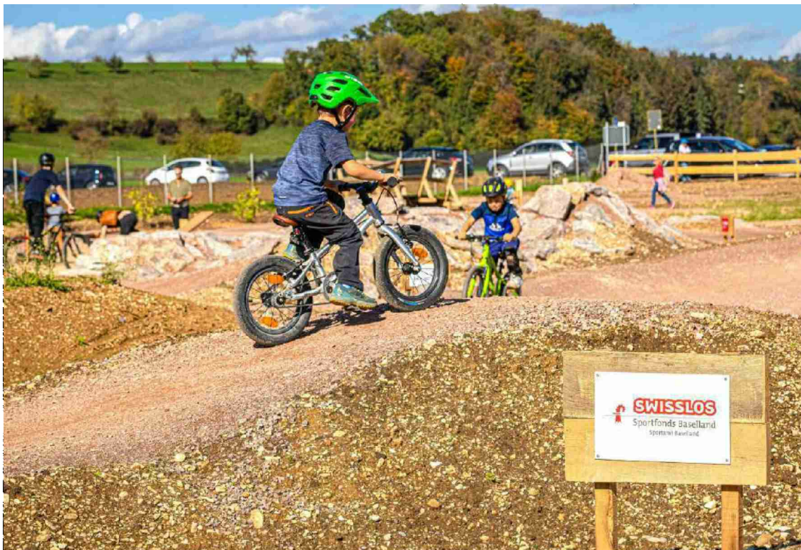
Das erste Trailcenter in der Nordwestschweiz wurde mit Geldern aus dem Swisslos-Sportfonds finanziell unterstützt.