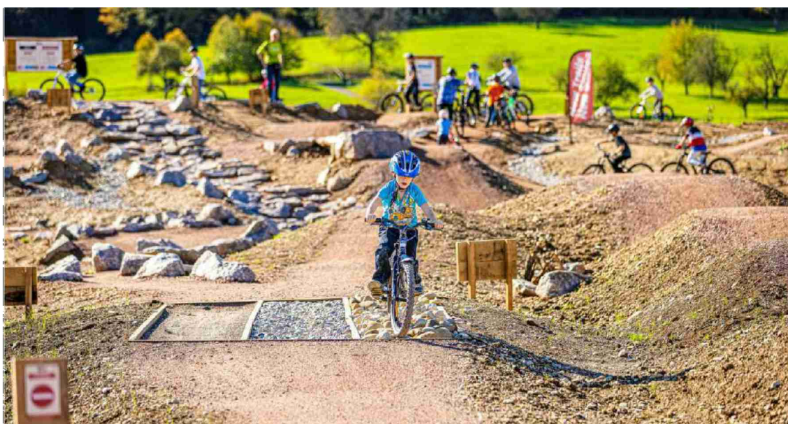
Das Trailcenter in Aesch lädt zu den Trail Days.