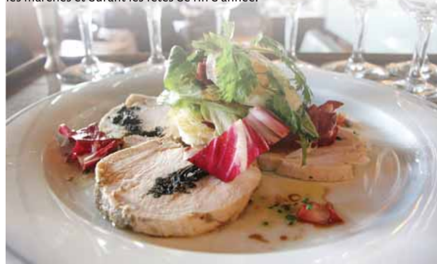
Galantine de volaille servie dans un restaurant bâlois.

Confectionné à base de clous de girofle, de cannelle, d'anis étoilé, le Magenbrot est un autre tendre pain d'épices recouvert d'un glaçage. Les Rosekiechli sont des beignets de rose saupoudrés de beaucoup de sucre très fin. Bonbons populaires en forme de dés, les tendres Basler Rahmtäfelchen ont la consistance et la saveur des caramels mous. Enfin, le Brunli - le «brun» de Bâle - est un biscuit au chocolat et aux noisettes hachées, très apprécié sur les marchés et durant les fêtes de fin d'année.