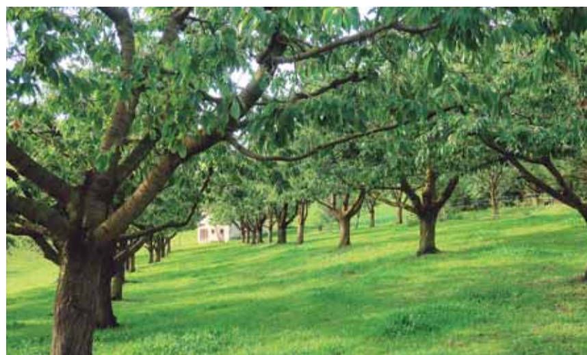
Bâle-Campagne figure parmi les plus gros producteurs de cerises suisses.