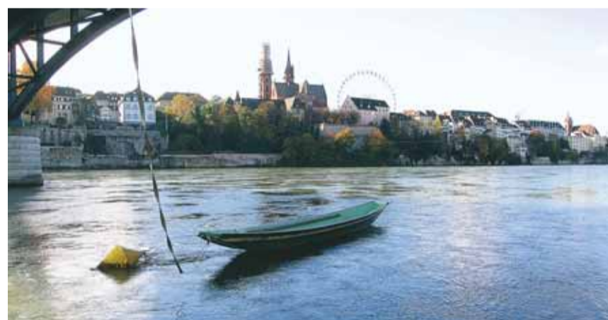
A Bâle-Ville, les vieux quartiers se groupent sur la rive gauche du Rhin.