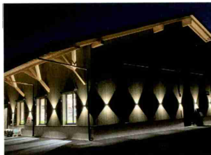
Beim Dorfladen Arboldswil tanken der Gast und das E-Bike Energie.