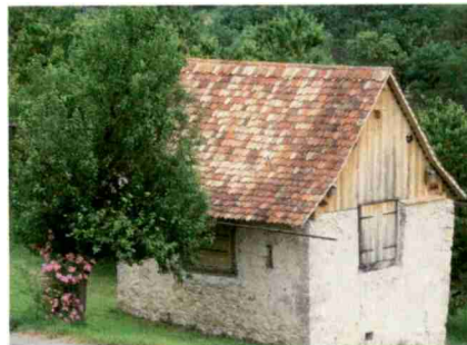
Im Hofschürli bei Kastelen frische Produkte geniessen.