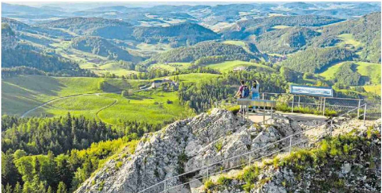
Ein besonderer Höhepunkt: die Aussicht von der Belchenfluh.

Das Wanderland Baselland begeistert mit landschaftlicher Schönheit und Vielfalt. Auf über 1100 Kilometern Wanderwegen lässt sich die Region zu Fuss entdecken.